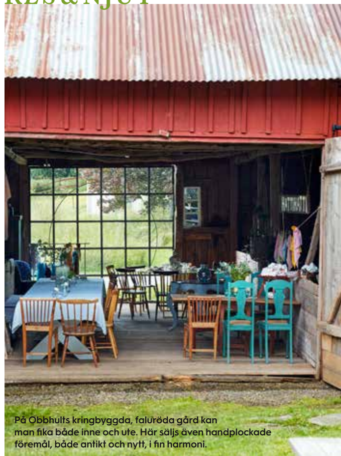
På Obbhults kringbyggda, faluröda gård kan man fika både inne och ute. Här säljs även handplockade föremål, både antikt och nytt, i fin harmoni.